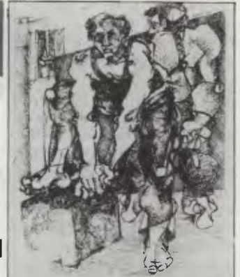
DİSK'le dayanışma gecesi Solidarity evening with DİSK

Örgütleyen: İngiltere Türkiyeli Öğrenciler Federasyonu & PNL TOD Organised by: Turkish Students Federation in UK (TSF) & PNL TS