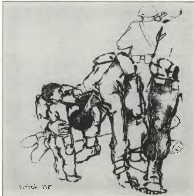
S. Erek 1981