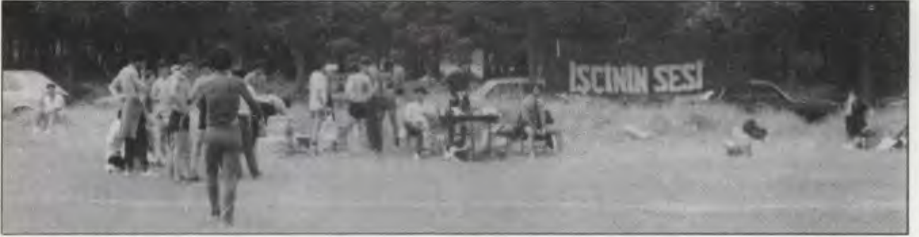
Fransa İlericiler Birliği'nin girişimiyle kurulan EMEK GÜCÜ futbol takımı Dostluk Turnuvası 1983'ten maçlara başlamadan önce