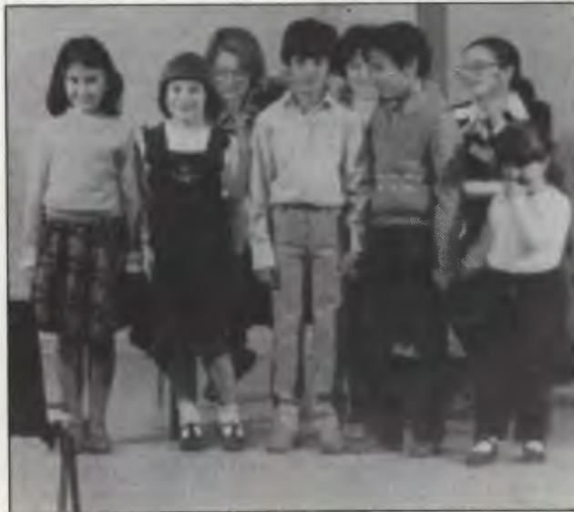
Sosyalist Çocuklar Kulübü üyeleri kongreye başarı dileklerini iletiyor

Toplantı bir Alman kadın yoldaşın Türkçe, Kürtçe ve İngilizce olarak söylediği, kadın sorununu dile getiren şarkılarla son buldu.