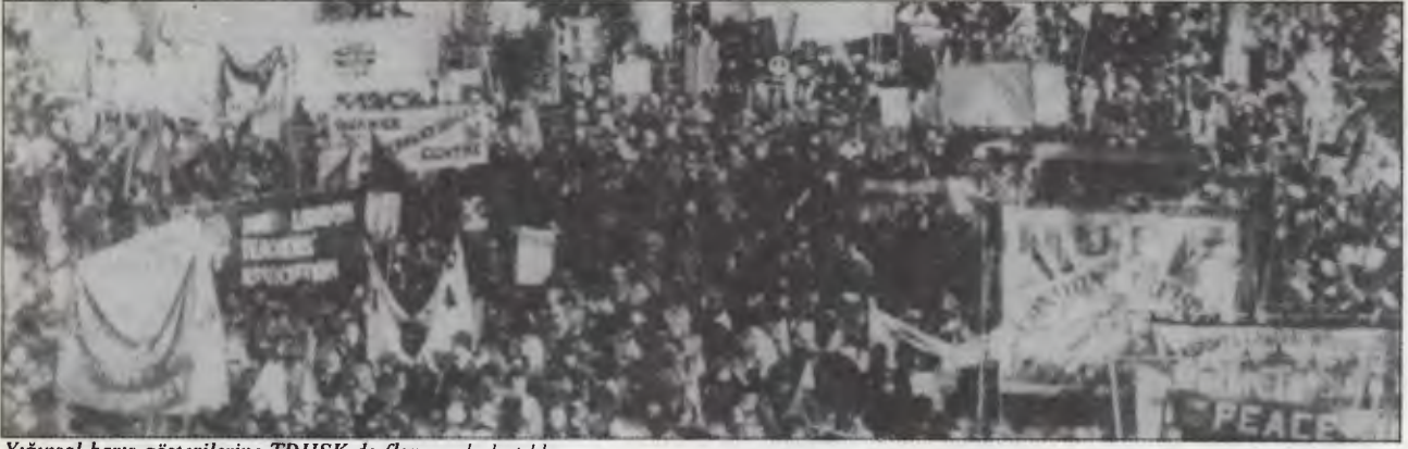
Yıgınsal barış gösterilerine TDHSK de flamasıyla katıldı