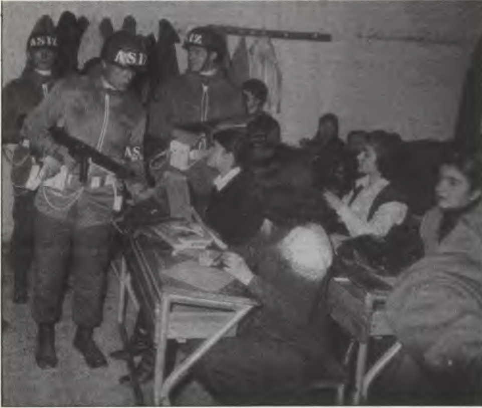
Türkiye'de kadınlara eşitliğin sağlandığı tek alan baskı, zulüm ve işkencedir.