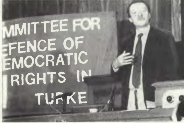
Ken Livingstone Uluslararası Konferans'ta

... Avrupa ağır bir deneyden geçiyor. 22 Kasım 1983'de Peshing II ve Cruise Misilleri üzerindeki düşünme süresi bitiyor. Eğer bir başka anlaşma yapılmazsa, Avrupa'nın