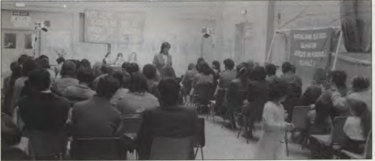
İTKB Kongresi'nden bir görüntü