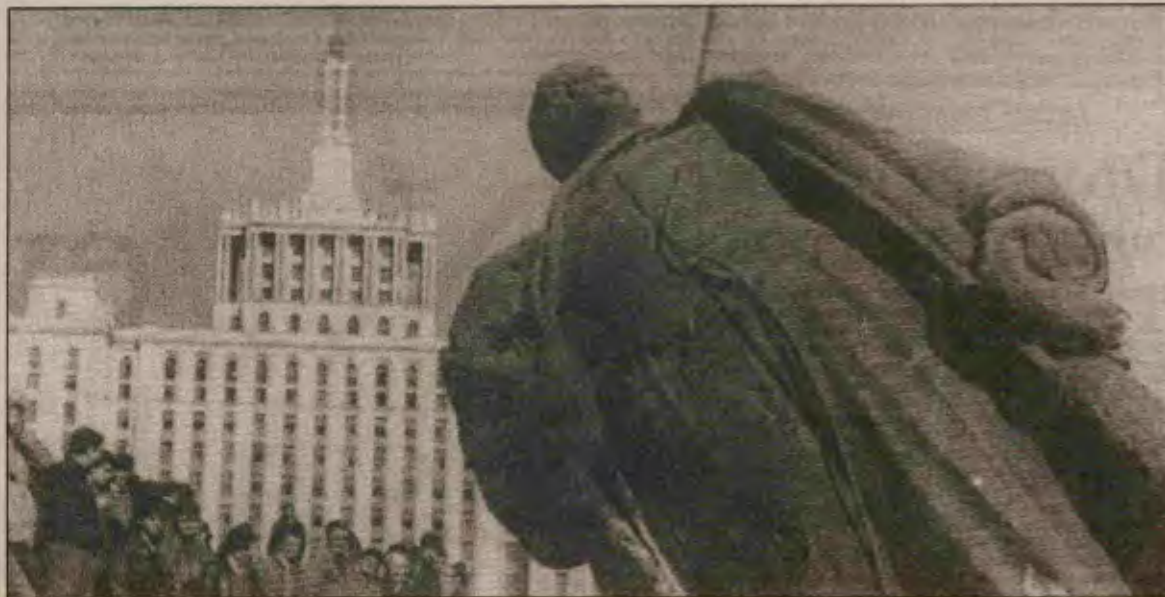
Gorbaçovçu karşı-devrimciler. RKP'yi yasaklayıp, Lenin heykelini yıktırdılar, özel mülkiyete geçtiler.

Yeni Demokrasi 'nin Ocak-Şubat 1990 sayısında çelişkili yazılar var. Başyazıda, Romanya'da olan "halk devrimi" değil, Sovyetler'ce tezgahlanan bir "darbe" dir deniliyor. Bir başka yazıda,