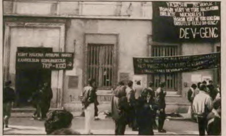
KGO flaması. Türkiye işçi sınıfının dayanışmasını ve istemini yansıttı.

Bu ipin ucunun devletin tepelerinde hangi karanlık ilişkilere ulaştığı da herhalde yakında ortaya çıkar. Ama Kürt emekçisinin başkaldırısının yükseldiği bir ortamda bu cinayeti kimin tezgahlayacağı konusu, hiç de karanlıkta değildir. En son Muhammer Aksoy'un, Çetin Emeç'in öldürülmesinde üzerinde kuşku olan yığınlaştığı MİT'in (ya da o türden karanlık örgütlerin) bu cinayetin de ardında olması için her neden vardır.