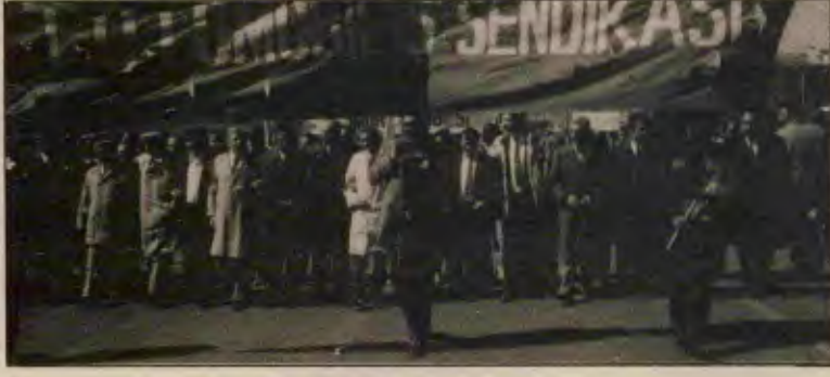
Otomobil-İş, Çelik-İş ve Özdemir-İş İzmit'te "birlik" kampanyası başlattılar

Yoldaşlarımızın bu sorunu çözeceklerine inanıyoruz. Türkiye işçi sınıfı ve emekçi halkımız, dünyada yükselen karşı-devrim dalgasına meydan okurken partimiz en önde olacaktır.