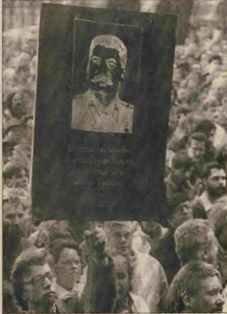
Yalnızca Romanya'nın değil, geneliyle sosyalist ülkelerin bugünkü durumundan alınacak çok ders vardır.

ülkelerin gelişmesine indirgenemez. Dünya sosyalist sisteminin yeni devrimlerle beslenmeden kapitalizmi geçmesi bir yana, çözümler tehlikesi vardır. Çağın dönüşümünü hızlandırmak ve geri dönüşsüz kalmak için devrimler gerekmektedir." (TKP Programı, s.16-17)