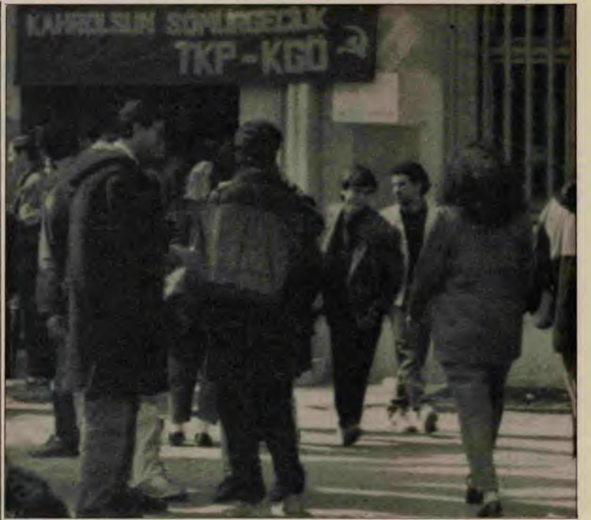
Toptancı siyaset üzerine çıkan yazı önümüzdeki öğrenim yılında izlenecek siyaset açısından yol gösterici oldu

İkincisi, ideolojik ayrılıktan bu yana hep partiye, partinin adına sahip çıktık. Tüm hatalarına, yanlışlarına, o dönemki işlevine rağmen "TKP komünistlerin, Lenincilerindir" anlayışıyla hareket ettik. Partimizden, partimizin adından kaçmadık, unutmadık, her koşulda, her an partiye ve adına sahip çıktık, bundan onur duyduk. Şimdi TKP tam da adına yaraşır bir yerde ve konumdadır. Bunu Marksizm-Leninizmden, komünist ideolojimizden taviz vermeyerek sağladık. Bu açıdan İGD isminin kullanılmasında hiçbir sakınca, görmüyoruz. Nasıl savaştığımızı, TKP yarattıysak, yine savaştığımızı, İGD yaratabiliriz.