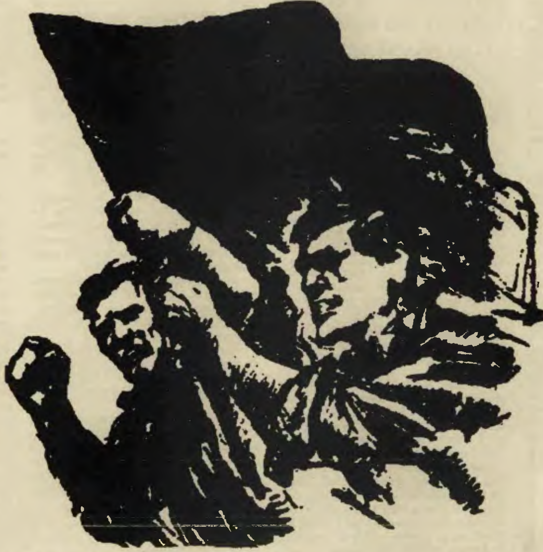
buraya resim altı

İŞÇİNİN SESİ, halkını ve devrimi ciddiye alanların, klişelerle değil, ülke gerçekleriyle düşünenlerin, açık kafalı, açık yürekli ve açık sözlü komünistlerin mücadele bayrağıdır!