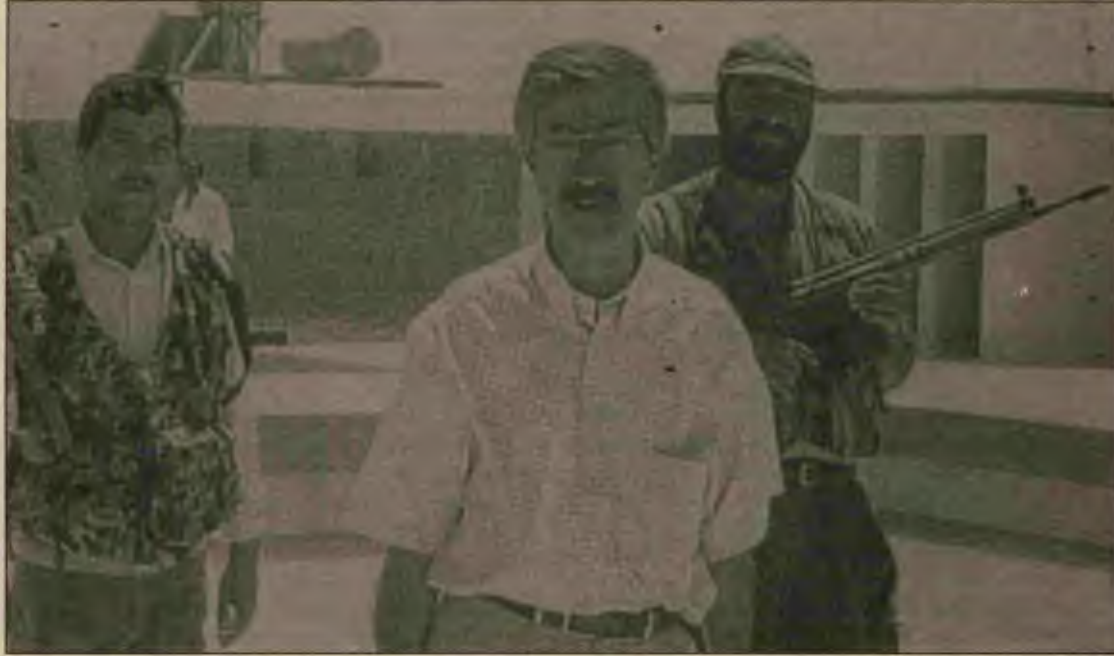
Korucular, "çetecilerin" korucusu! Nereye kadar?

Burjuvazinin terörüne karşı savaş birliğini güçlendirmek gerekiyor. Türkiye'de devrimin başını Türk-Kürt Halkının ortak mücadelesinden, savaşım birliğinden geçer. Bu nedenle TKP, geçen yıl DHKP ile PKK arasında imzalanan protokolün ardından, yayınladığı MK Bildirisi ile bu girişimi desteklediğini ve bu yönde atılacak pratik adımların yaşama geçirilmesi için üzerine düşen görevi yerine getireceğini kamuoyu önünde açıklamıştır.